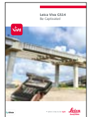
Leica Viva GS14