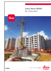
Leica Nova MS60